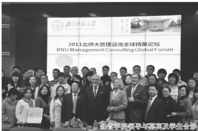
经管学院领导与嘉宾及学生合影

本次研讨会的成功举办，使中外业界嘉宾获益良多，大家同时希望拓宽合作空间，加强交流与合作，发挥各自优势共生共赢，共同引领和推动管理咨询业未来的发展。